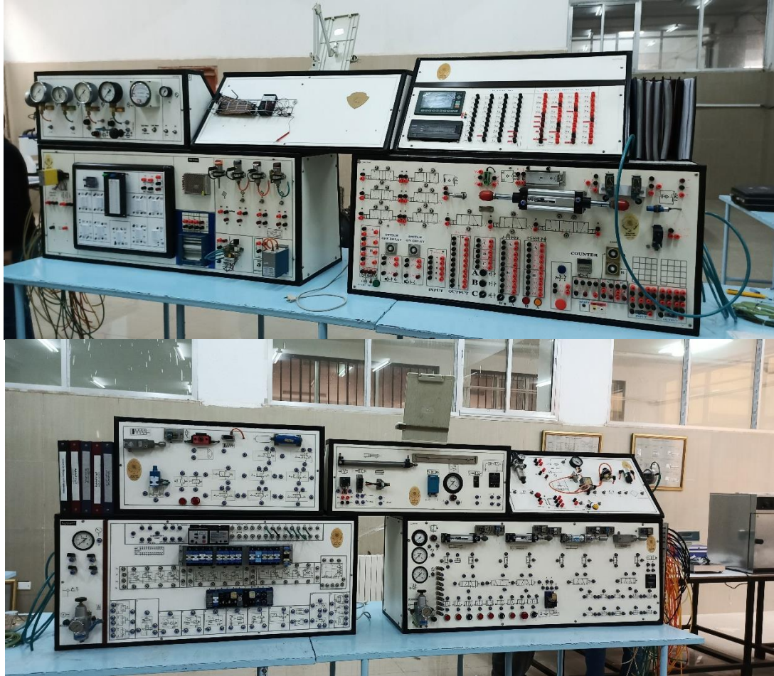
مخبر التحكم الآلي والأتمتة الصناعية - جامعة الفرات - كلية الهندسة - دير الزور - سورية.